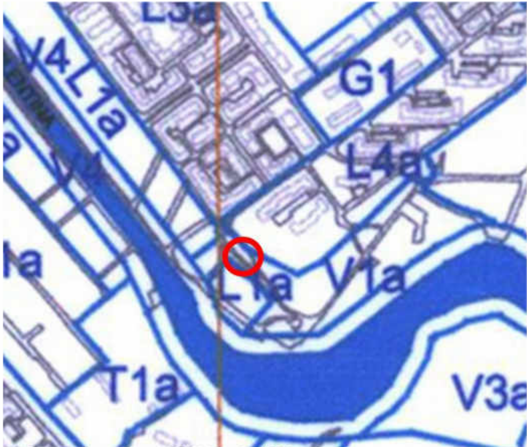
P.U.G. Bucuresti, aprobat cu H.C.G.M.B. nr. 269/2000